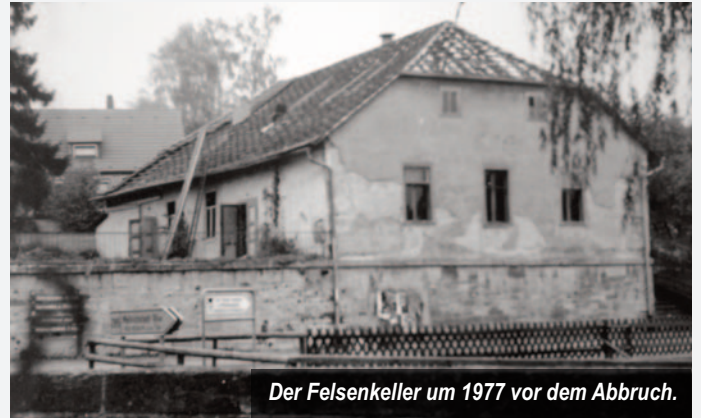
Der Felsenkeller um 1977 vor dem Abbruch.