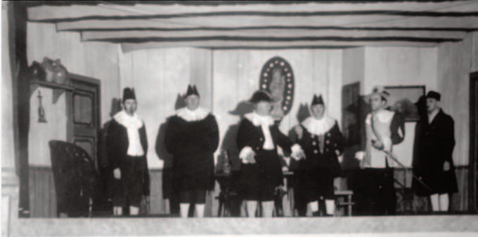
Fladunger Theaterspieler führen 1950 auf der Festhallenbühne das Stück „Schwedennot über Fladungen“ auf.