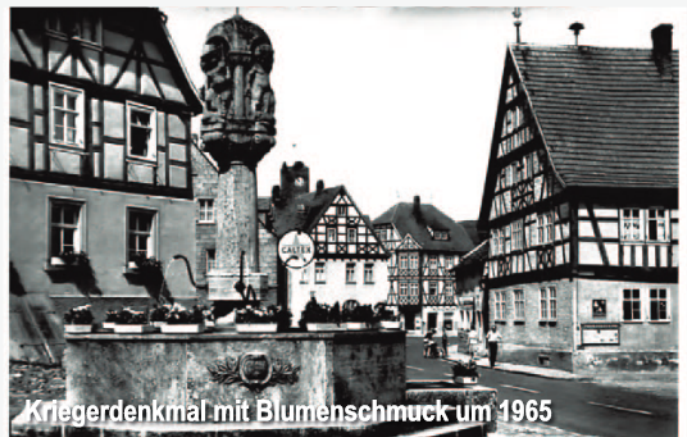
Kriegerdenkmal mit Blumenschmuck um 1965