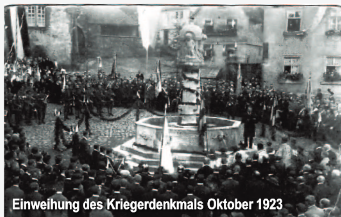
Einweihung des Kriegerdenkmals Oktober 1923