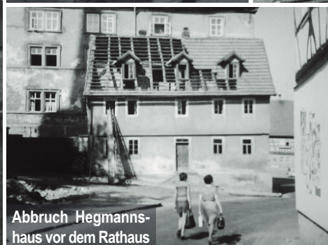
Abbruch Hegmanns-haus vor dem Rathaus