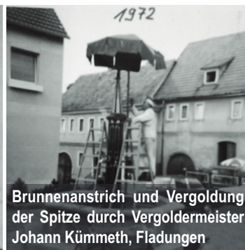
Brunnenanstrich und Vergoldung der Spitze durch Vergoldermeister Johann Kümmeth, Fladungen