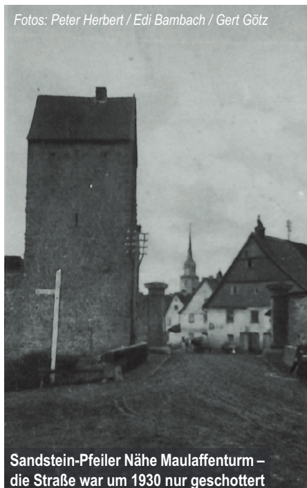
Sandstein-Pfeiler Nähe Maulaffenturm – die Straße war um 1930 nur geschottert