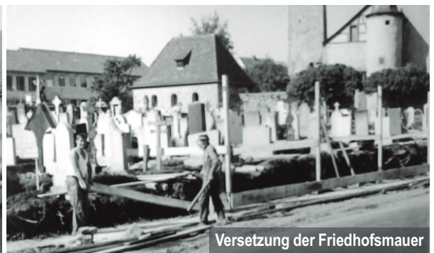
Versetzung der Friedhofsmauer