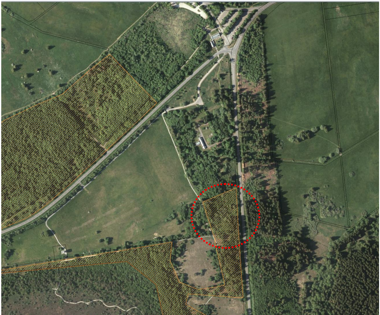
Ausschnitt aus FIS-Natur Oline /FIN-Web) des Bayerischen Landesamtes für Umwelt mit den Flächen des Ökoflächenkatasters (orange Schraffur), Stand 22.07.2025. Rot umrandet der Teilbereich der FI.Nr. 8163